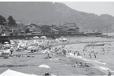
日本海 藤崎海水浴場