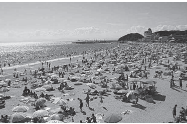
太平洋 南知多町海水浴場